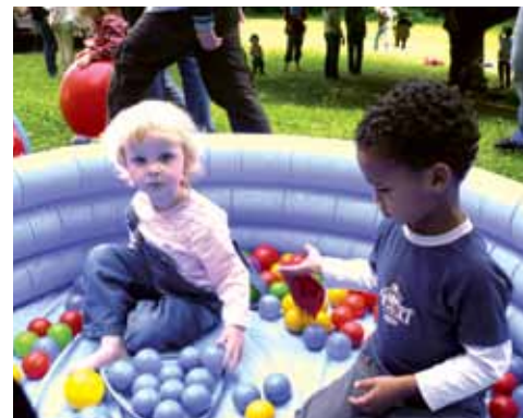
Auf dem Sommerfest, der Bällepool