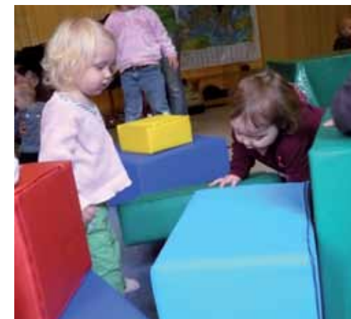
Bauen mit großen Elementen