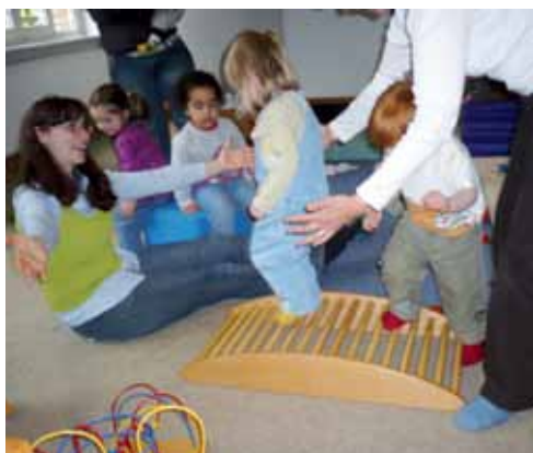
Motorische Förderung, die „Brücke“