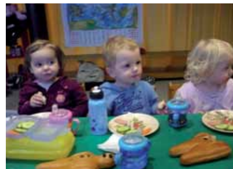
Gemeinsames Frühstück, lecker...