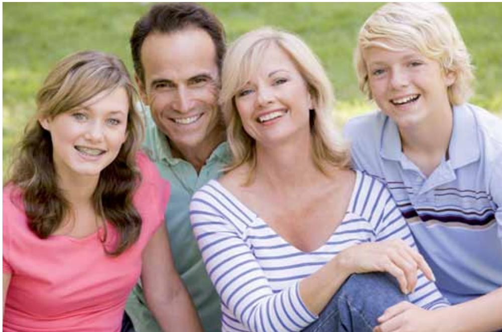
Starke Kinder brauchen starke Eltern!