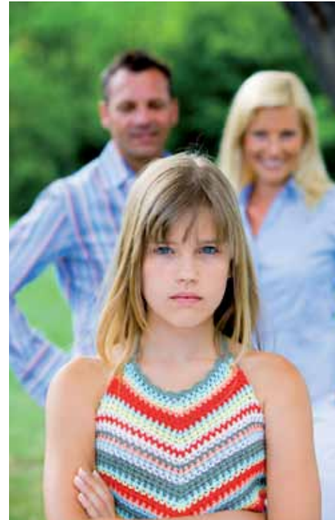
Eltern stärken das Selbstvertrauen ihres Kindes