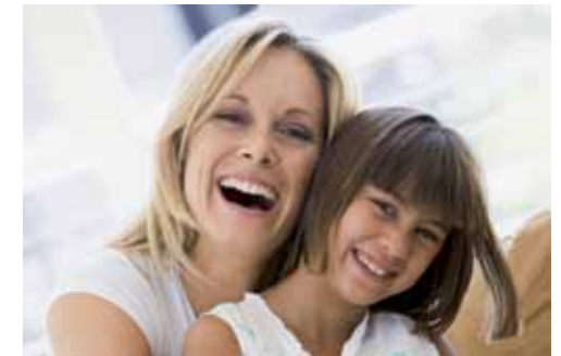
Weniger Streß – mehr Spaß an der Erziehung