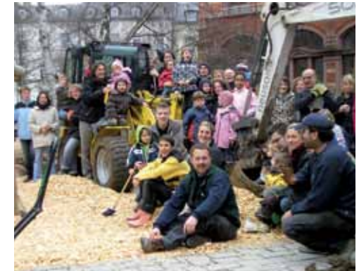
Gemeinsam schaffen wir es

Erziehung und bestmögliche Förderung des Kindes kann nur gelingen, wenn Eltern und ErzieherInnen eng und vertrauensvoll zusammenarbeiten. Das ist in jedem Alter der Kinder wichtig, aber um so mehr, je kleiner die Kinder sind. Deshalb sind uns auch Eltern herzlich willkommen. Sie können mit uns gemeinsam Feste gestalten, sich im Elternbeirat engagieren oder sich mit eigenen Ideen und ihren besonderen Fähigkeiten einbringen.