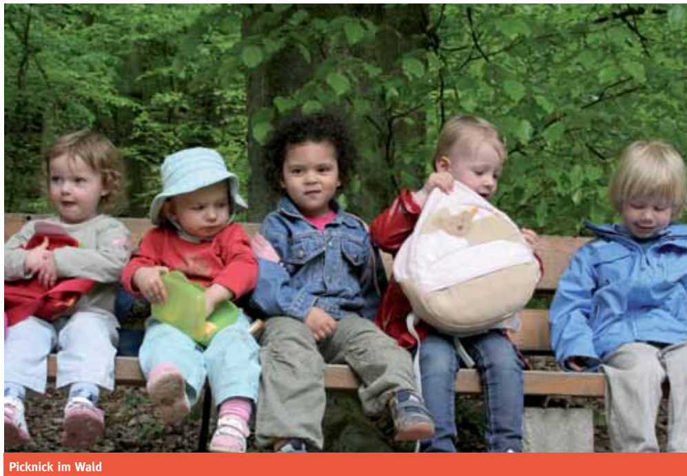
Picknick im Wald

Spielen, Lernen und Entwicklung sind untrennbar miteinander verbunden! Insbesondere lernen kleine Kinder durch spielerisches Tun. Nur während des Spiels, dieser scheinbar so mühelosen Beschäftigung des Kindes, setzt sich das Kind auf seine eigene Art mit seiner sozialen Umwelt auseinander, erforscht, begreift und „erobert“ sie. Es macht sich ein Bild von der Welt, d.h. es bildet sich! Deshalb ist das ausdauernde und konzentrierte – in sich versunkene – Spielen für die kindlichen Lern- und Entwicklungsprozesse von nicht zu unterschätzender Bedeutung. Wir lassen Raum dafür!